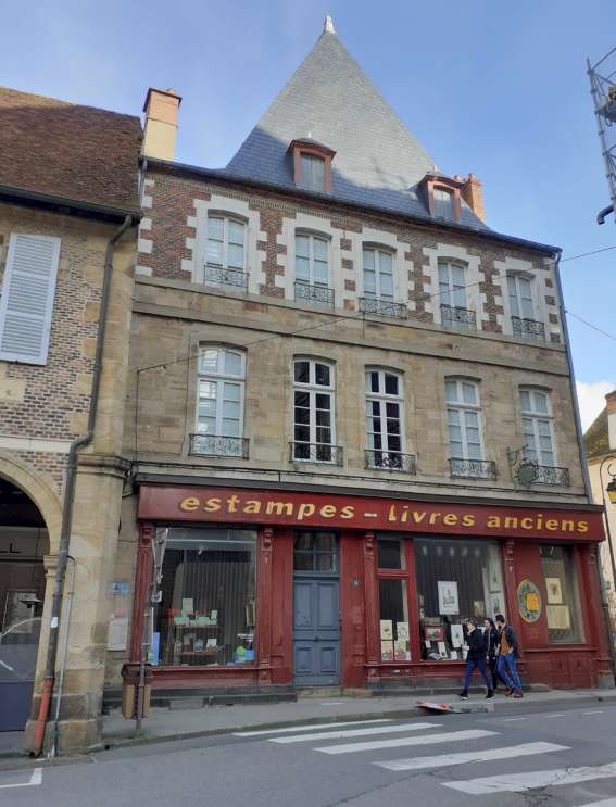
Façade sur rue remaniée en 1768

Un pas de côté Place des Vosges ancienne halle aux blés xvii e siècle - 8 arcades