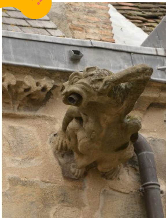
Réponse à l'intérieur du lieu ou service patrimoine à l'Hôtel Demoret

Une gargouille sert-elle à recracher l'eau de pluie ?