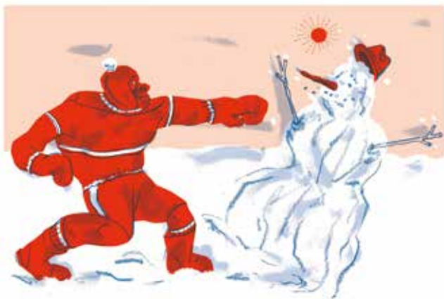
Gerda Dendooven Vent d'hiver : petites histoires pour réchauffer les jours froids La Joie de lire, 2020

Toutes les expositions sont à dévorer des yeux !